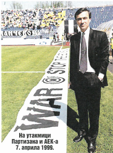
На утакмици Партизана и АЕК-а 7. априла 1999.

- Сматрам да је непобитна чињеница да се данас суочавамо са измењеним социјалним и политичким околностима на геополитичком плану, које су угрозиле опстанак Хришћанства као најдоминантније религије на свету, и то не само на духовној и моралној равни, већ је угрожен и његов физички опстанак. Центар за заштиту хришћанског идентитета је основан са циљем да својим активностима скрене пажњу домаће и светске јавности на бројне нападе на хришћане и њихове сакралне објекте, на дехристијанизацију Европе као и угрожавање опстанка породице као основне ћелије друштва. Бројни су примери напада на хришћане и њихове цркве и манастире, и то од злостављања до генцидних размера над хришћанима у Сирији као и целом региону Блиског Истока, укључујући и Копте у Египту, рушење црква и манастира на КиМ, напади у Нигерији, Пакистану, Индији, скидање 70 крстова са црква у Кини, терористички напади на цркве у Ници, Бечу и Лиону, присиљено преименовање хришћанске цркве Свете Софије у Константинопољу у дамију, и бројним другим местима широм света. Залажем се за одржавање предавања на тему "Заштита хришћанског идентитета у једном од најтежих историјских тренутака за опстанак наше вере", и спреман сам да га у име Центра за заштиту хришћанског идентитета из Београда, одржим на било ком месту, где постоје потреба и интересовање за тако нечим.