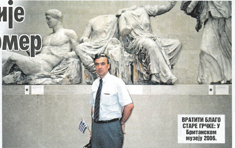
ВРАТИТИ БЛАГО СТАРЕ ГРЧКЕ: У Британском музеју 2006.

- То су највећи скандал и брука културне историје савременог света. Заправо, лорд Елгин је пре 200 година био амбасадор Британског краљевства у тада поробљеној Грчкој од стране Отоманског освајача. Извршио је класичну злоупотребу положаја кад је, служећи се коруптивним средствима, добио одобрење од турских власти да врши одређена "истраживања" око Акропоља. Уместо тога, британски амбасадор је унајмио раднике који су металним тестерама девастирали најзначајнији спо-