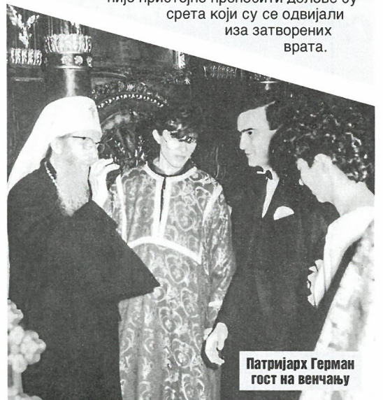
Патријарх Герман гост на венчању

налазим, изразио је протест и огорчење поводом недавне изјаве Албина Куртија да српске православне цркве и манастире на КиМ "види искључиво у контексту албанске историје". На овај начин покушава да се изврши албанизација српског културног и духовног блага. Апсурд је да то чине исти људи који су девастирали и до темеља спалили 135 српских црква и манастира, што недвосмислено наводи на закључак да им уопште није стало до њихове заштите, већ то чине искључиво ради формирања сопственог идентитета без кога не могу да заокруже тзв. косовску независност. Сигуран сам да ће српски званичници дати адекватан одговор